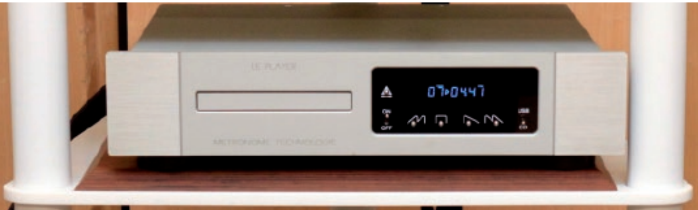
▲ Reproductor CD Metronome Le Player, con entrada USB trasera hacia su DAC interno

Excelente combinación de caracteres: la dulzura del amplificador Accoustic Arts con la claridad de las cajas Bowers... ¡sinergia total!