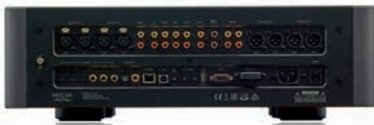
▲ Irreprochable, el panel posterior es además un dechado de buen gusto por el cuidado puesto en la organización de las diferentes tomas pese a que la de tipo USB hubiera resultado más práctica en el panel frontal