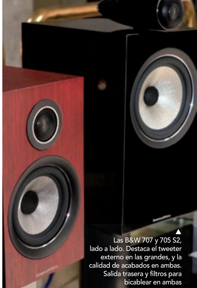
Las B&W 707 y 705 S2, lado a lado. Destaca el tweeter externo en las grandes, y la calidad de acabados en ambas. Salida trasera y filtros para bicablear en ambas

Dicen el refrán que en el frasco pequeño se guardan las mejores esencias, y las 707 S2 nos sedujeron ofreciendo además una relación música/precio más que sobresaliente. No